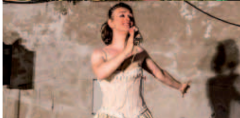
A mi no me escribió Tennessee Williams (porque no me conocía)