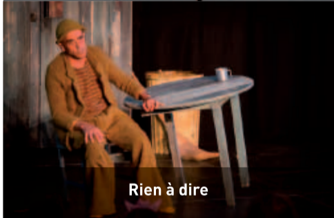
Rien à dire