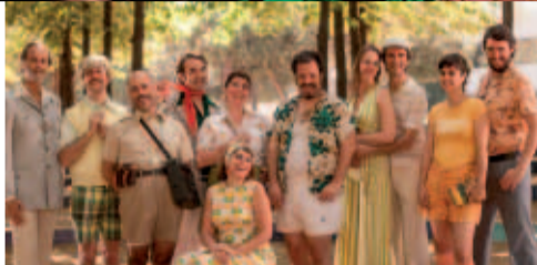
Les alegres casades de Windsor