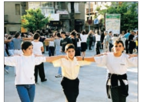
II Aplec de la Sardana de Rubí