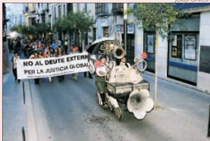
Cercavila i cantada festiva reivindicativa per la justícia global

La Xarxa Ciutadana per l'Abolició del Deute Extern de Rubí en el MRG treballarà pel control internacional del sistema econòmic perquè superi el dèficit democràtic. La pròxima cita serà a Barcelona l'any 2001. Mentrestant treballarem en els nodes locals per a donar a conèixer el nostre moviment mitjançant actes com la cercavila i cantada festiva reivindicativa del passat 26 de setembre a Rubí i tallers de debat sobre Justícia Global.