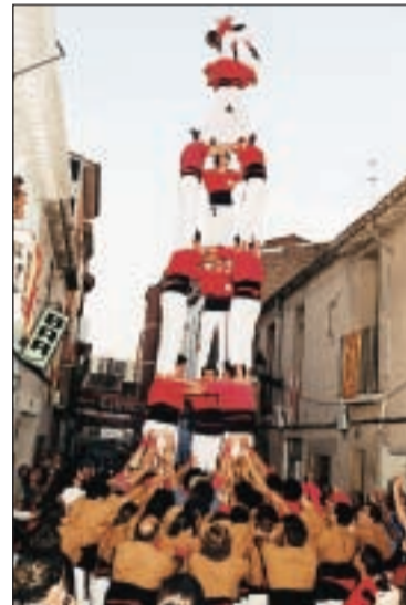
El tres de set dels Castellers de Rubí