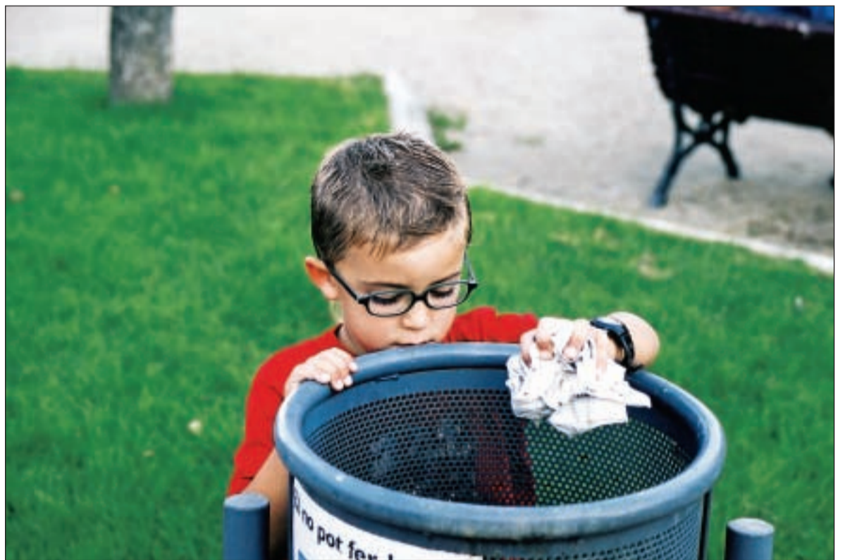
El programa pel civisme engegarà diverses campanyes per fomentar actituds positives envers la convivència

Pel que fa a l'acció més disciplinària, l'Ajuntament està treballant en la revisió de les ordenances de tinença d'animals i de la via pública, que recolliran des de la gestió de permisos fins les sancions que contempli la legislació. En aquest sentit, es preten actuar sobretot, de cara al control d'animals al carrer (excrement o gossos