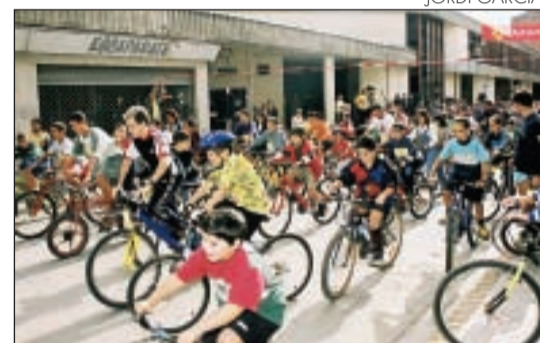
Ambient festiu de la Bicicletada

Al final de la prova es van atorgar els premis a la bicicleta més original, a la millor disfressa i al grup més imaginatiu. Alguns participants també van rebre vals de regal i, com volien els organitzadors, la prova va acabar en una gran festa.