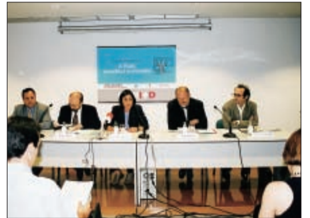
Una de les activitats va ser una xerrada