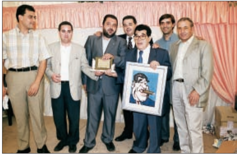
Membres de la junta de la Penya Blaugrana Ramon Llorens

A part del futbol, la penya també ha tingut una secció de futbol sala i s'han fet i es fan altres ac-