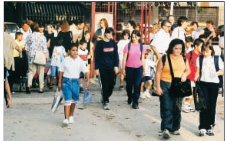
El passat 15 de setembre va començar el curs escolar