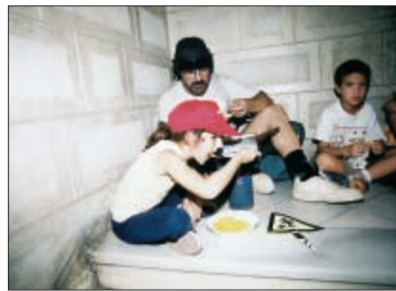
Alumnes i pares dinant a l'Ajuntament

hi ha hagut cap acord entre les parts, ja que els pares volen que es portin els nens a dinar a un altre lloc, mentre que l'Ajuntament i la Generalitat proposen habilitar espais de l'escola com a menjador fins que s'acabin les obres i que els nens dinin per torns, cosa que els pares rebutgen.