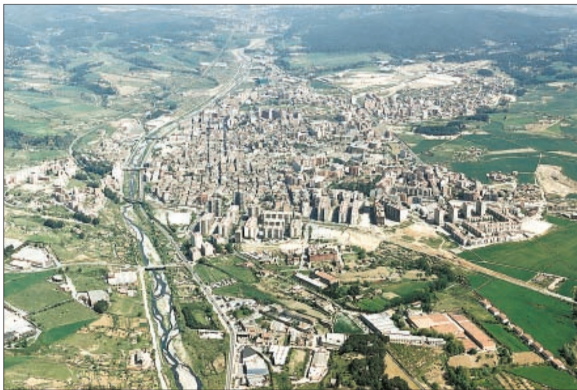
La divisió territorial de Rubí marcarà la participació ciutadana als pressupostos municipals

Aquest procediment de divisió territorial també comptarà amb la participació de la ciutadania,