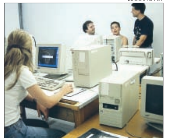
El taller de plàstica introdueix les noves tecnologies

en l'estudi i la pràctica de diversos aspectes bàsics per a elaborar una proposta de disseny gràfic. El primer trimestre, des de setembre fins a desembre, es realitzarà el curs d'introducció al disseny, on aprendran a resoldre problemes de composició en la creació d'un cartell, d'una pàgina, etc. Durant el segon semestre podran traduir els dissenys treballats en el trimestre anterior al llenguatge informàtic del curs de dis-