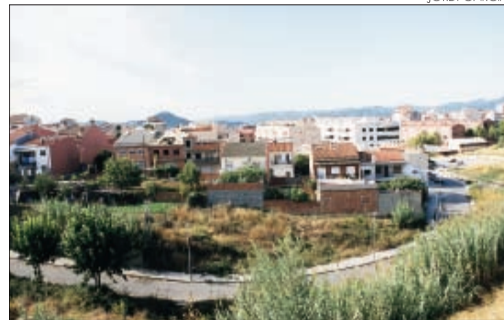
VII trobada de Puntaires de Rubí