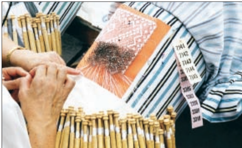
Can Rosés Residencial, una urbanització que vol millorar

Pel que fa a l'adequació de parcs infantils, la presidenta de l'AP comenta que, de fet, se'ls ha enganyat dues vegades, ja que, d'una banda, els van dir que darrere el carrer Ping Pong, on hi ha una plaça petita sense sortida, hi anava un parc infantil i no es va fer. D'altra banda, quan l'Ajuntament va fer el pavelló poliesportiu i la piscina coberta, quedava una parcel·la de terreny on, tot i que