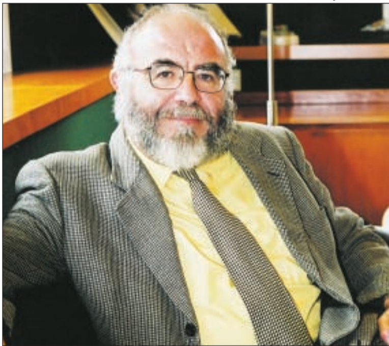
Jaume Pagès Fita, rector de la Universitat Politècnica de Catalunya

Ha de ser un lligam responsable en el qual cadascú sigui capaç d'entendre quins són els interessos de l'altra part i ser capaçs d'emprendre accions conjuntes on cadascú guanyi alguna cosa pel fet de col·laborar amb l'altre. A nosaltres ens interessa estar al dia dels problemes que preocupen les empreses, institucions o entitats que d'alguna manera impulsen el desenvolupament del país, perquè és la nostra feina resoldre aquest tipus de problemes i fer recerca, investigar i empènyer l'avanç del coneixement en la direcció que pugui interessar de cara al