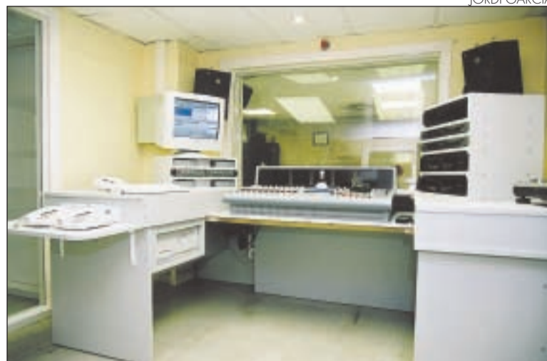
El remozado estudio de directo de Ràdio Rubí