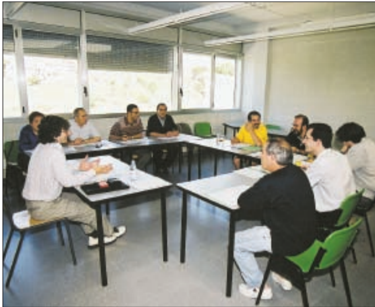
Los miembros de la UAB han mantenido diversas reuniones con entidades

Según el acuerdo al que han llegado los 160 ciudadanos y representantes de 60 entidades que