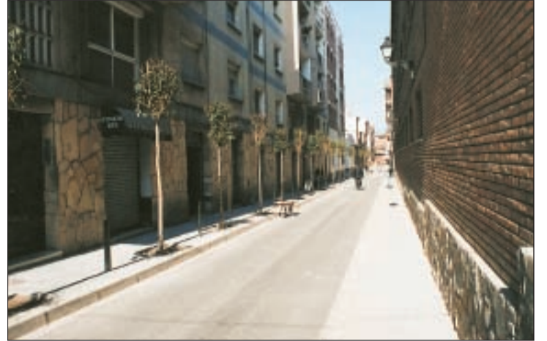
Imatge del carrer Espoz i Mina