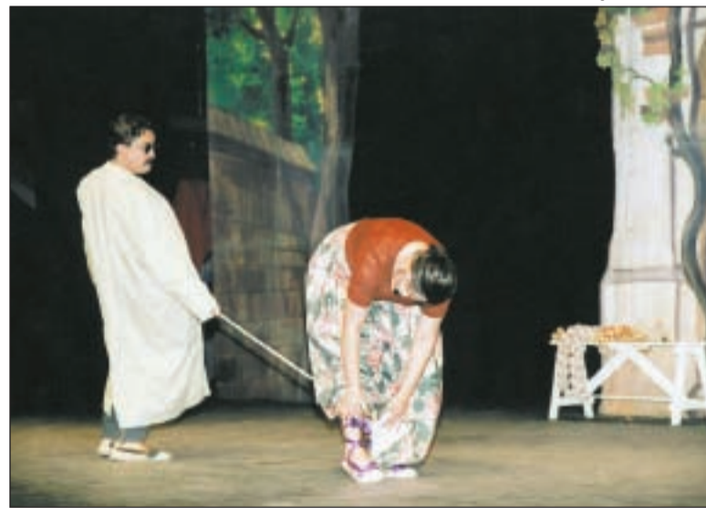
Representació de l'obra La ceba , del grup Dos de dos