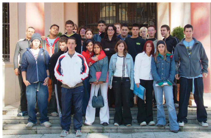
Els alumnes del Pla de Transició al Treball van fer una visita a l'Ajuntament