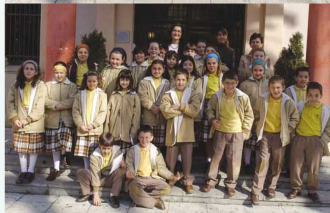
Els dos grups del Regina Carmeli que van visitar l'Ajuntament