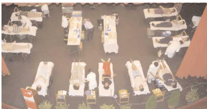
Marató de donació de sang a La Sala

L'atenció sanitària de qualitat a Rubí és una de les prioritats de la regidoria de Salut Pública, que segueix de prop el projecte del 3er CAP, un projecte que el govern català ha de tirar endavant aquesta legislatura i ha de permetre descongestionar els centres sanitaris de la ciutat.