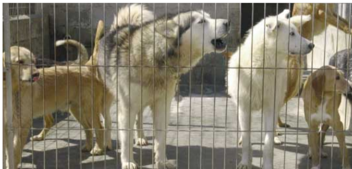
Instal·lacions de la protectora d'animals DESA

Pel que fa a la promoció de la salut, les competències que té l'Ajuntament són molt bàsiques: des de la prevenció, campanyes de programes de salut, als centres educatius, campanyes de sensibilització, vacunacions preventives, etc. ■ M.L.