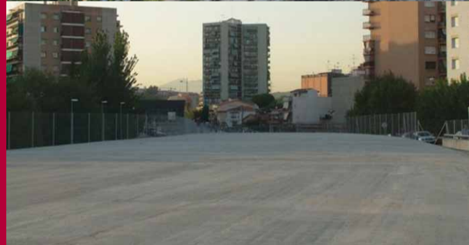
L'abans i el després del cobriment