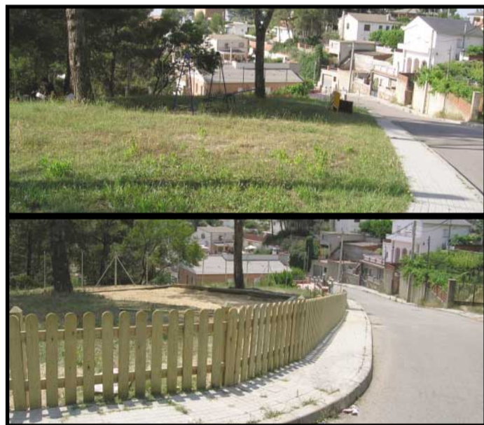
Actuación en el Parc Vallès

Servicios Urbanos, a través de la Brigada de Obras, continúa realizando diversas intervenciones en toda la ciudad. En las imágenes se puede apreciar el estado anterior y el actual después de la actuación realizada en la zona de Vallès Park, mediante la cual se ha recuperado un espacio verde y se ha construido una nueva zona de ocio infantil.