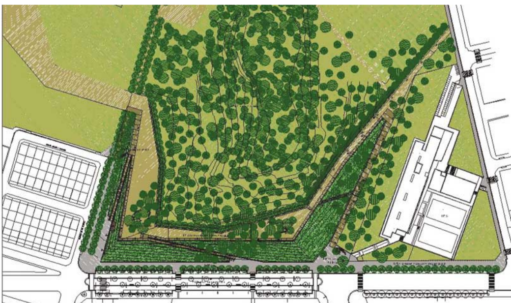
Plano cenital del parque