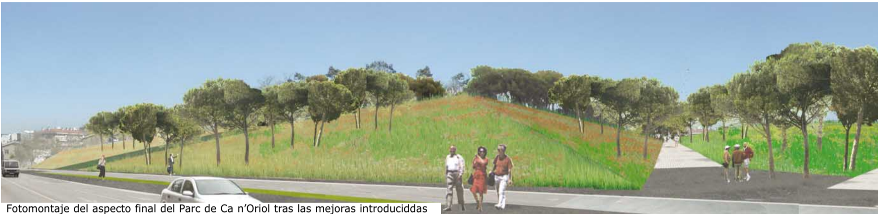
Fotomontaje del aspecto final del Parc de Ca n'Oriol tras las mejoras introducidas

Revista municipal ■ 8 de juliol de 2004 ■ Núm. 113 ■ www.rubiciutat.net