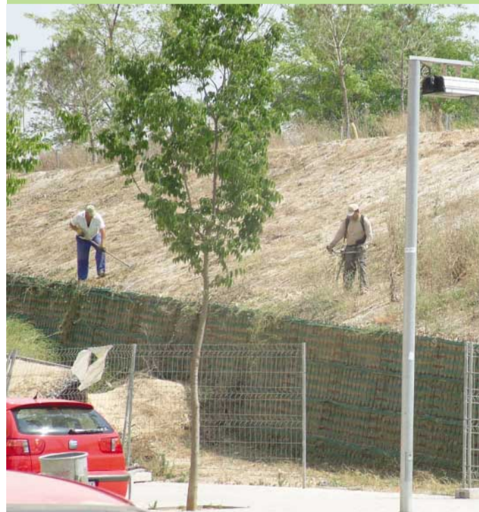
Operarios trabajando en las modificaciones previstas