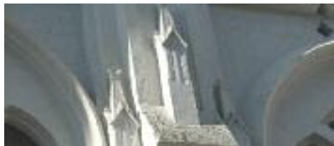
Un dels nombrosos detalls de la façana