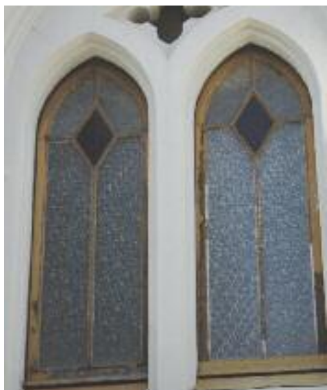
Les grans finestres