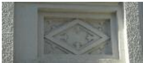
Un altre relleu de la façana principal