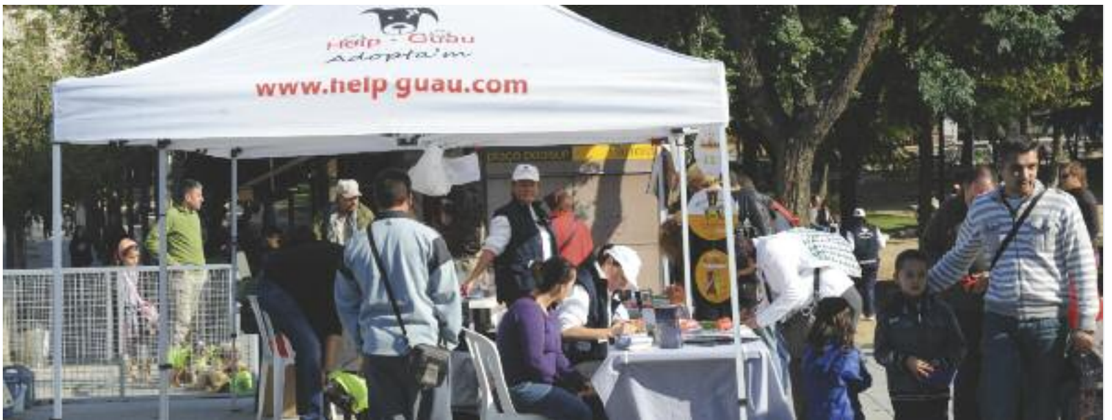
La Feria se traslada en esta ocasión a la rambla del Ferrocarril

Además, durante estas ferias, los adoptantes reciben información sobre las zonas de recreo para animales en la ciudad y sobre como ser responsable en el cuidado de los animales.