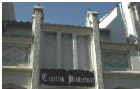
Detall de la façana a sobre de la porta principal