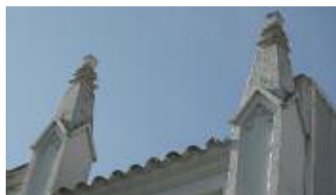
L'edifici és d'estil neogòtic

Amb aquest article finalitzem la sèrie de 16 reportatges "Coneix el patrimoni de Rubí" que vam iniciar el maig del 2010 amb El Castell.