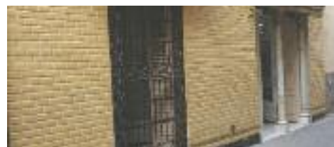
Majòliques rectangulars de la façana