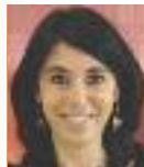
ERC Arés Tubau Portaveu del Grup Municipal d'ERC

les que cobren aquesta prestació que és de pura subsistència. I en paral·lel, el govern Mas ha continuat amb les retallades sanitàries previstes. D'altra banda, acabem l'agost amb l'anunci de noves mesures que ens retallen drets i benestar per part del govern Zapatero, com ara l'encaïment sense límits dels contractes temporals o la modificació del dèficit i el deute a través d'una refor-