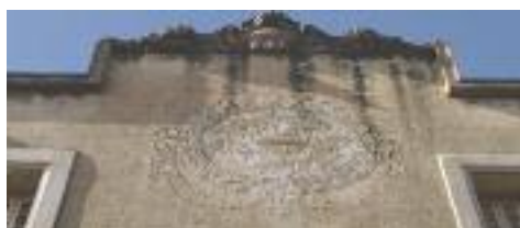
Gravat a la façana principal