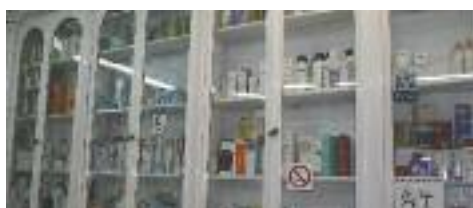
Estants interiors modernistes