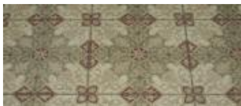
Ceràmica del terre