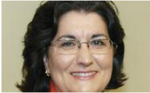
CARME GARCÍA LORES Alcaldeessa de Rubí

A partir de setembre, els rubinencs i rubinenques gaudirem d'un nou espai a la ciutat: el nou poliesportiu situat a La Llana, que donarà cabuda a diversos esports i disciplines esportives amb unes condicions d'alta qualitat. La nova instal·lació està dotada dels elements més moderns per a la pràctica d'esports com el bàsquet o l'hoquei en línia, entre d'altres.