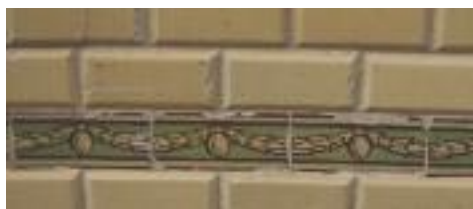
Detall sanefa decorativa