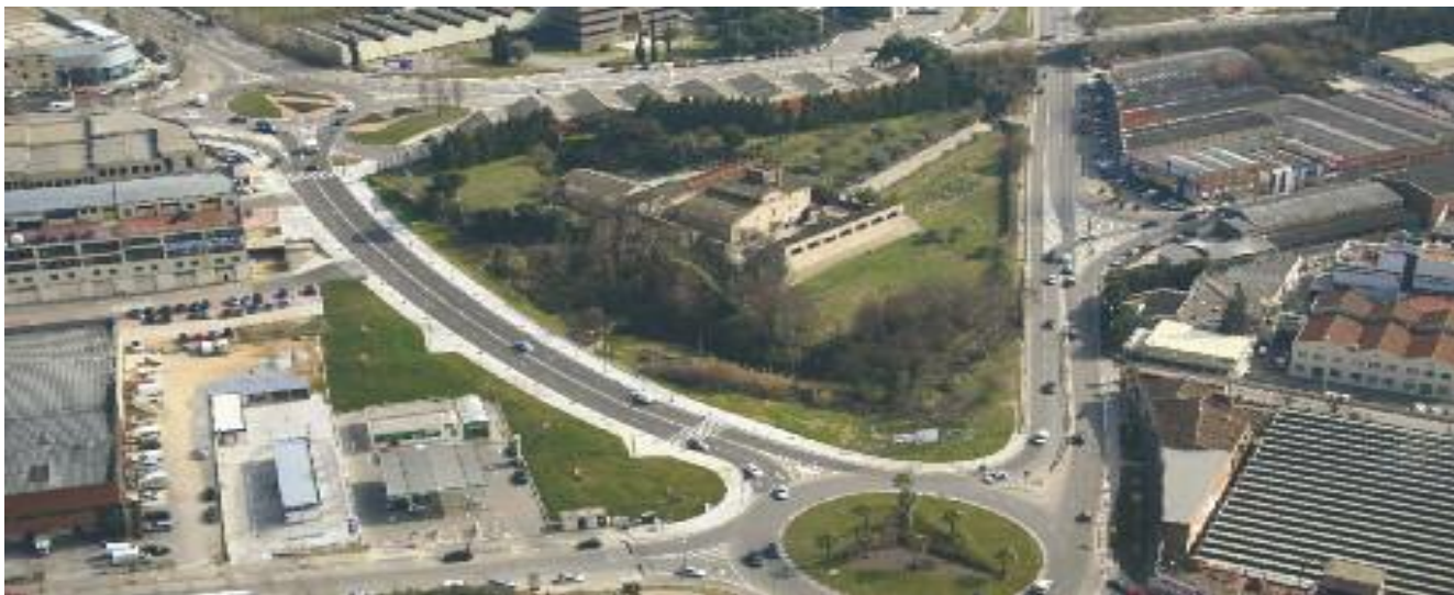
El polígon El Molí de la Bastida ocupa un total de 32 hectàrees