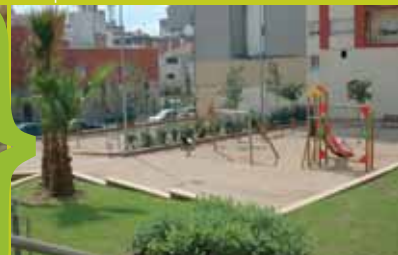
plaça santa rosa. Té 1143 m 2 i les obres van acabar el setembre passat. S'hi va plantar vegetació més adient per a la zona i s'hi han instal·lat espais de jocs infantils i zona de descans per a la gent gran.