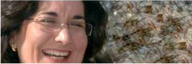
carme garcía Iores Alcaldesa de Rubí

Rubí es una ciudad que busca su identidad, que quiere ser querida, que necesita la complicidad de sus ciudadanos y ciudadanas. Una complicidad que en los últimos meses recibo a menudo de forma personal o a través de internet a modo de sugerencias para mejorar las calles, los parques, la seguridad, la ciudad en general, y sobretodo para ampliar los servicios que todos y todas recibimos como ciudadanos por parte del Ayuntamiento u otras administraciones. La revista La Ciutat de este mes de junio explica, precisamente, el resultado de proyectos que en breve serán realidad gracias a la voluntad de este ayuntamiento y a la colaboración de muchos ciudadanos y ciudadanas