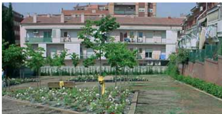
Obres d'enjardinament a la plaça del c. Terol

també s'estan fent obres a la plaça de Figueras, que té més de 3.000 m 2 . Abans era de sorra i de gespa i ara, a la part de terra, s'hi ha col·locat un paviment nou. Des del passat mes de març, s'està col·locant la zona verda. L'espai s'ha dividit en tres parts: un escenari per a fer actuacions, un espai infantil amb gronxadors i una zona per a llegir, amb bancs i ombres. També s'ha arreglat la font de la plaça i es plantaran nous arbres. A la part central de la plaça s'instal·larà una font que unirà les diferents zones. Està previst que aquests treballs finalitzin a finals d'aquest mes de juny, de la mateixa manera que els que s'estan fent a la plaça del carrer Terol. En aquest cas, la plaça del carrer Terol era tota de terra i ara també tindrà gespa, tanques arbustives, jocs infantils, bancs i espais per a passejar. Aquestes tres places, però, no són les úniques que s'estan renovant al municipi de Rubí.