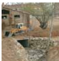
obres del col·lector la construcció del nou col·lector ja ha finalitzat

Rubí té més de 17.000 arbres i 80 places