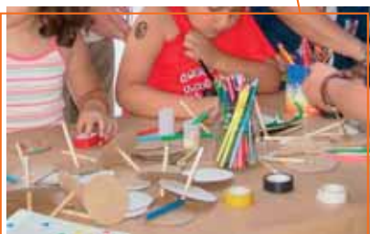
Tallers de joguines, xapes, maquillatge, disfresses; jocs del món amb danses, taller de trenes africanes i de henna; i activitats per a infants de 0 a 3 anys