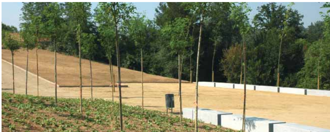
Aspecte del parc que s'està fent a Can Sedó

ha al voltant perquè siguin de passeig. Aquest parc estarà connectat amb el de Ca n'Alzamora a través de rampes suaus. El nou parc permetrà unir els dos barris: el de Can Sedó i el de Ca n'Alzamora.