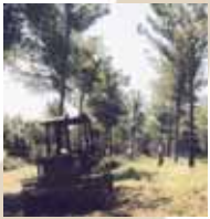
trabajos de prevención limpieza de matorrales

30 km de pistas forestales acondicionadas