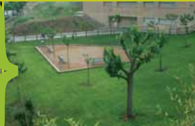
plaça de les moreres. Té 974 m 2 i es va arreglar en el 2004. S'hi ha plantat gespa, s'hi ha instal·lat una tanca de bambú, bancs, papereres i s'hi han fet unes escales noves d'accés.