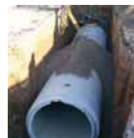
obres del col·lector s'han construït 200 metres de col·lector

L'avinguda Barcelona està en obres des del passat 23 de gener, quan es va començar la renovació dels 200 metres de col·lector que la travessa. De forma paral·lela s'ha soterrat la xarxa de baixa tensió a càrrec de Fecsa-Endesa, com a resultat del conveni signat entre l'Ajuntament i la companyia elèctrica l'any 2004 i que afecta