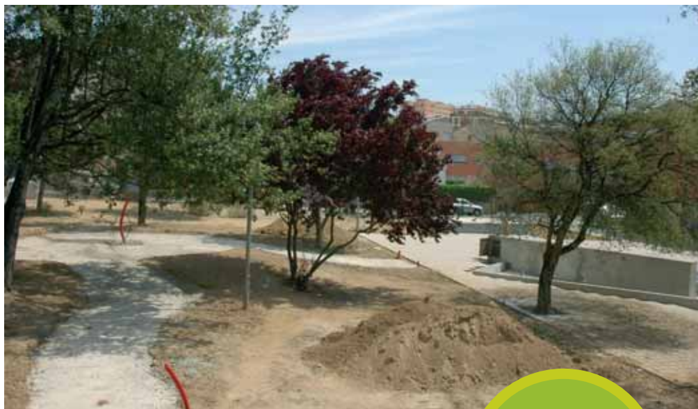
Obres a la plaça Estantislau Figueras

L'Ajuntament de Rubí ha invertit més de 300.000 € per construir, equipar i enjardinar un total de 5 places a Rubí. Concretament, són les tres places anteriors, juntament amb les places de Les Moreres, Font de la Via i Santa Rosa.