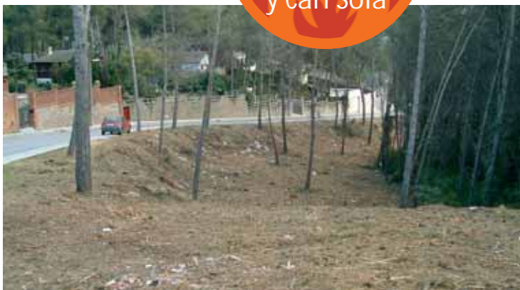
Franja de protecció en Can Mir