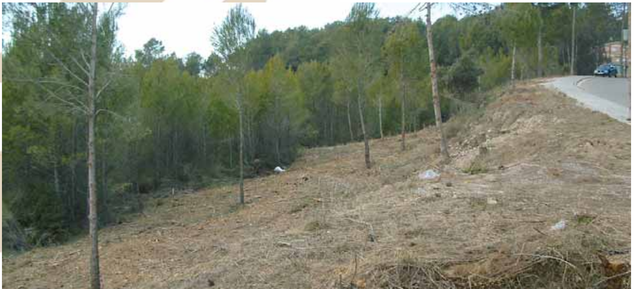
Franja de protección en Can Mir

En los torrentes también se han hecho acciones de protección. Es el caso de los cuatro sectores de Castellnou y de Can Solá, donde se ha abierto 11 franjas de unos 40 m de ancho que separan el torrente con la zona de árboles y de vegetación. Paralelamente, se han hecho actuaciones de limpieza de matorros y tareas de mantenimiento de los hidrantes.