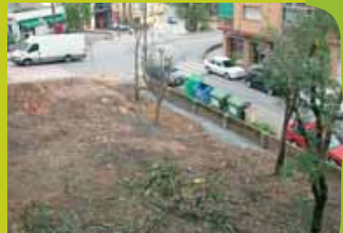
plaça font de la via. Té 758 m 2 i es va construir el 2004-2005 en un terreny que estava en un estat lamentable.