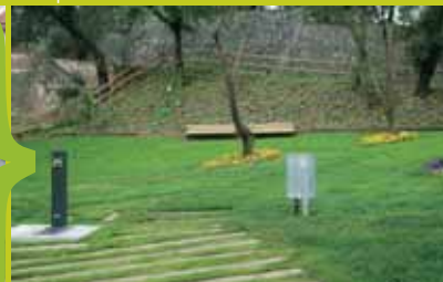
Té bancs, font, dues taules de picnic, arbres i escales.