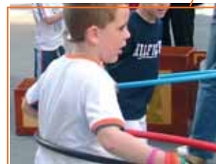
Ciclisme, minigols, rocòdrom inflable, bàdminton, llits elàstics, patinatge, etc.