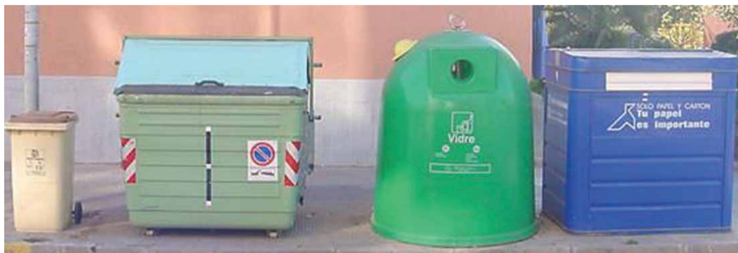
De izquierda a derecha los diferentes contenedores: materia orgánica, basura desechable, vidrio y papel, respectivamente

La recogida selectiva incluye algunos materiales como el vidrio o el papel, elementos que son fácilmente separables del resto de la basura que generamos en casa, y así podemos ayudar a recuperar estos materiales de una forma sencilla. Cerca de nuestros hogares encontraremos los diferentes contenedores para depositar estos residuos.