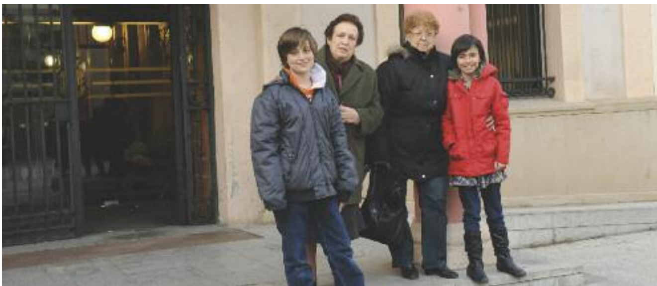
Integrants del Consell dels infants i del Consell de la gent gran

12 persones formen part del Consell de la gent gran i 46 del consell dels infants