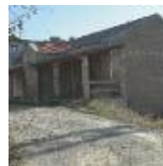
ENTRADA NORD ES CREARÀ UNA NOVA PLAÇA QUE COMUNICARÀ AMB LA PORXADA DE L'EDIFICI

Així, es crearan tres espais diferenciats a l'exterior del Celler, tenint en compte els tres nous accessos de l'edifici. A l'entrada nord (c/ Pintor Murillo), que dona accés al primer pis de l'equipament, es crearà una plaça que comunicarà amb el porxo d'accés al Celler, on l'Ajuntament està estudiant la possibilitat que, en un futur, s'hi instal·li un bar amb terrassa exterior. Just davant de la porxada es mantindran 3 moreres, entre les quals es col·locaran tres bancs, mentre que a la cantonada amb el c/ Pintor Coello s'instal·laran 5 cadires més, tot creant un espai de trobada i relació. A l'entrada oest (c/ Pintor Coello), en una cota més baixa, es crearà una altra plaça, en la qual es plan-