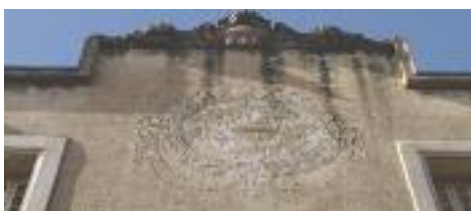
Gravat a la façana principal