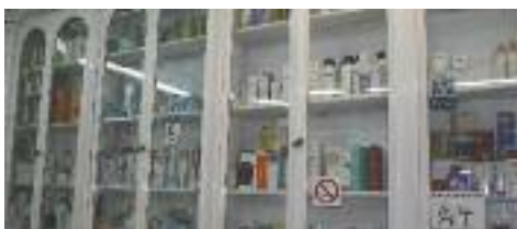
Estants interiors modernistes