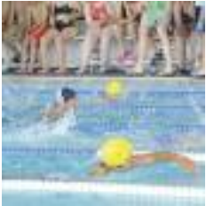
NATACIÓN UNO DE LOS DEPORTES QUE SE PUEDE PRACTICAR POR LIBRE

Más de 1.400 niños y jóvenes participaron durante el curso 2009-2010 en los programas escolares