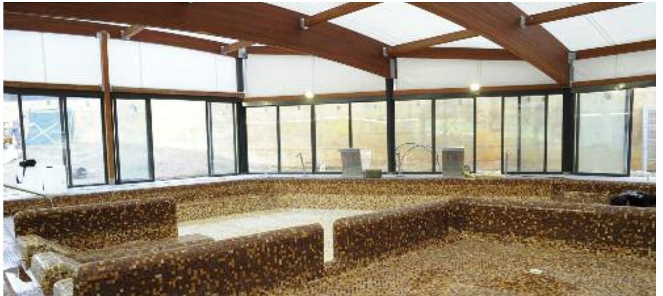
La piscina de Can Rosés ha ampliado instalaciones con esta nueva zona de spa.

Estas mejoras forman parte de las últimas obras de adecuación de las instalaciones de Can Rosés, que incluyen, por ejemplo, la colocación de una nueva cubierta en la piscina exterior.