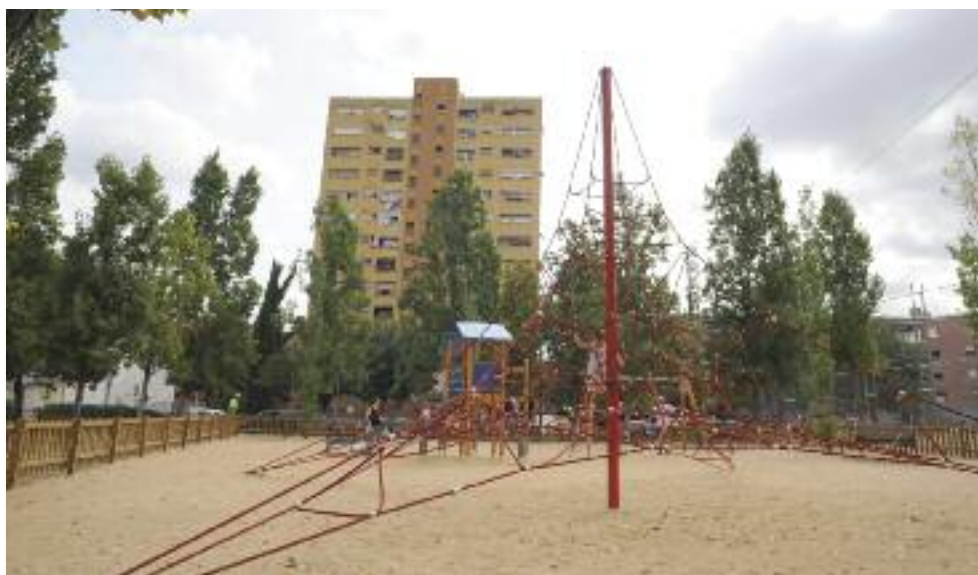
Nuevos juegos en la zona infantil

El CEM 25 de setembre tiene una superficie total construida de 11.000 m 2 distribuidos en 4 plantas y ha supuesto una inversión de 9,3 millones. Ocupa 4.215 m 2 de los 23.000 m 2 de superficie del Parc de la Pau i la Natura.