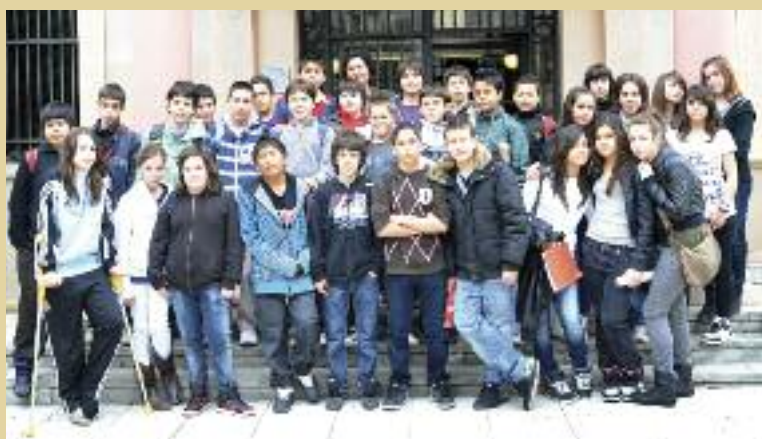
Alumnes de l'IES L'Estatut van visitar l'Ajuntament