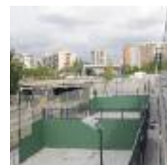
PADEL EL COMPLEJO DEPORTIVO CUENTA CON 4 PISTAS

El día 25 de septiembre, a las 12 h, se inaugurará el nuevo equipamiento y acto seguido las entidades vecinales y deportivas conocerán a través de una visita guiada los diferentes servicios del complejo construido y gestionado por la empresa Duet Sports. La ciudadanía en general podrá visitarlo el sábado por la tarde y el domingo, 26 de septiembre, todo el día.