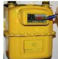
SERVEIS PRÀCTICAMENT EL 50% DE LES RECLAMACIONS SÓN PER SERVEIS

d urant els vuit primers mesos de 2010, l'OMIC ha tramitat les consultes i reclamacions de 1.680 ciutadans que consideraven que no s'havien respectat els seus drets com a consumidors. El servei ha aconseguit, en el que portem de 2010, que es retornin 44.936,76 euros als reclamants i 144.000 euros durant l'exercici passat.