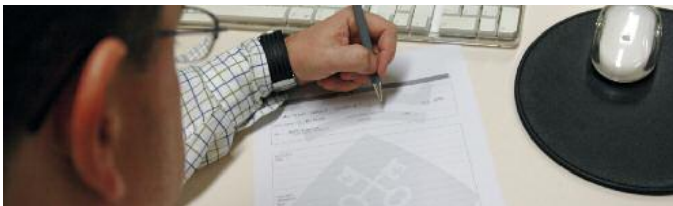
Es poden presentar reclamacions presencialment i a través del web municipal www.rubi.cat

Principalment, a l'OMIC arriben reclamacions relacionades amb diferents serveis, sobretot els de telefonia. L'any 2009, pràcticament el 50% de les reclamacions gestionades tenien relació amb empreses proveïdores d'aigua, electricitat, gas o telèfon. En aquest darrer àmbit, l'OMIC ha gestionat la devolució de 16.952,93 euros fins a l'1 de setembre d'enguany.