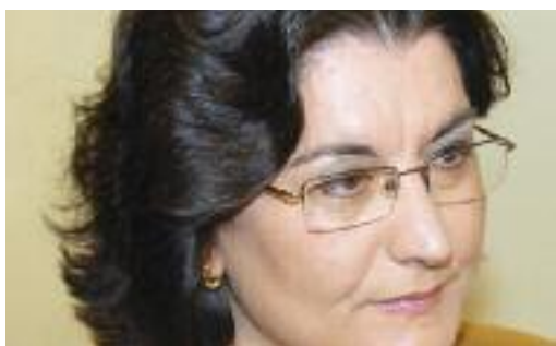
CARME GARCÍA LORES Alcaldessa de Rubí

Fer esport és fer salut. Però l'esport també és un component bàsic en l'educació i la formació personal, ja que transmet valors com l'esforç, la col·laboració i l'esperit solidari, entre d'altres. Sota aquesta premissa, l'Ajuntament té entre les seves prioritats el foment de la pràctica esportiva a tots els nivells.