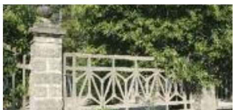
Imatge de la tanca original