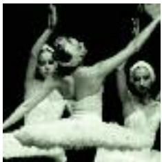
DANSA A MÉS DE TEATRE, LA TEMPORADA ESTABLE INCLOU ESPECTACLES DE DANSA

R ubí a escena és una nova proposta cultural que permetrà conèixer el teatre i la música que es creen a Rubí, de la mà d'artistes i músics de la ciutat, i es podran veure tant a la temporada estable de La Sala com a l'auditori de la Biblioteca. Pel que fa al cicle de cinema VO, aquesta tardor la proposta serà Cinema i literatura, amb films basats en obres literàries.