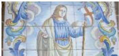
Detall d'una imatge de Sant Jordi que es troba a la façana