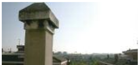
Des del terrat es veu l'autopista