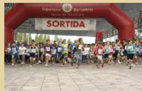
Cursa de Sant Muç