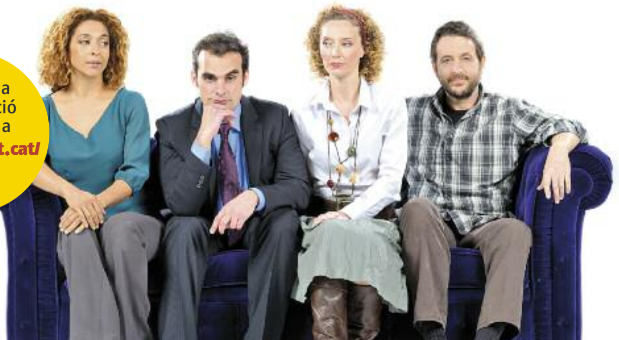
L'obra "Un déu salvatge" es podrà veure al novembre

Consulta la programació completa a www.rubicat.cat/cultura