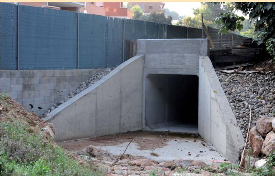
El calaix de formigó canalitzarà l'aigua de la riera de Can Solà

Ara per ara, la franja de Can Tapis ja està pràcticament acabada. Els operaris han fet tot el tractament silvícola. Els trossos de fusta gran que s'ha generat amb la desbrossada s'han tallat en unitats més petites perquè puguin ser retirats més fàcilment. Després que les obres s'hagin hagut d'aturar durant l'estiu per l'elevat risc d'incendis, ara han tornat començar.