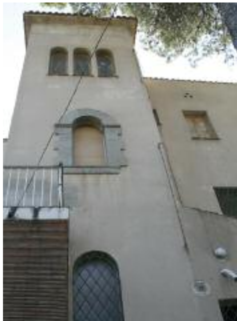
Vista lateral dels finestrals originals