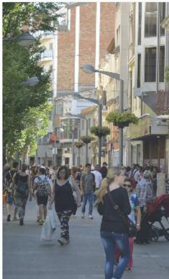
Rubí disposa de 1.641 activitats comercials

LES FRANQUÍCIES COM A OPCIÓ UNA JORNADA POSARÀ EN CONTACTE FRANQUICIADORS I EMPRENEDORS