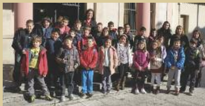
Alumnes de l'Escola 25 de setembre van visitar l'Ajuntament