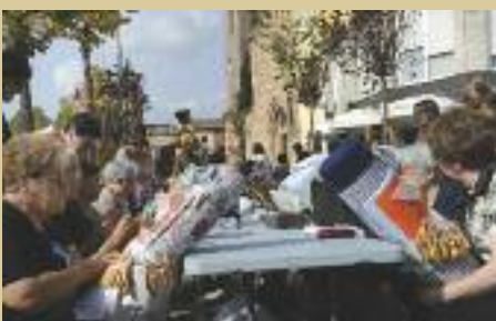
La Trobada de Puntaires es farà a la plaça del Doctor Guardiet