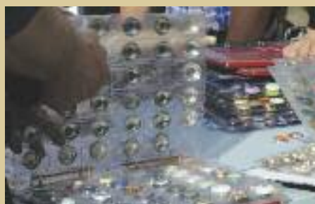
Trobada de col·leccionistes de Plaques de Cava