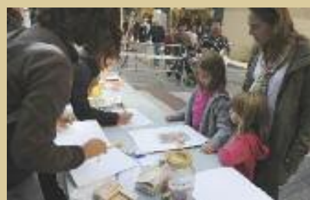
Els nens gaudiran d'un espectacle infantil a la pl. Montserrat Roig