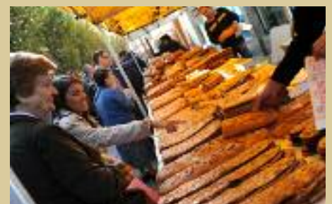
L'alimentació es concentrarà a la pl. Catalunya i el pg. Francesc Macià