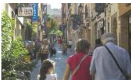
Carrer de Sant Cugat