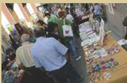
L'art es trobarà als carrers Xercavins i Sant Francesc