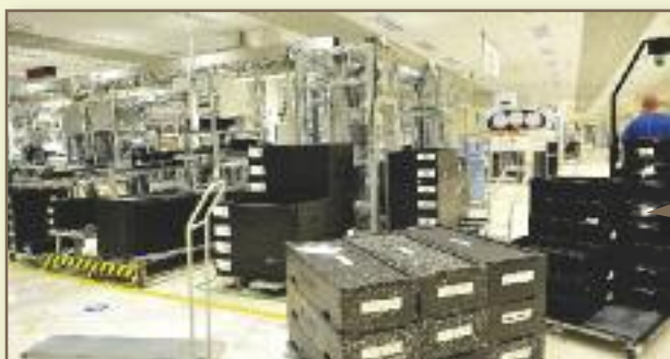
Una de les empreses del PAE és Continental Automotive Spain SA, que enguany celebra 25 anys a Rubí