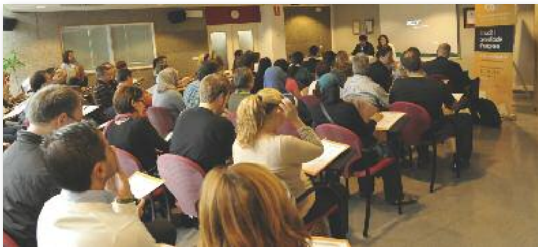
Presentació de l'Escola d'emprenedoria, a finals de setembre

L'escola té com a propòsit a llarg termini un canvi important en la formació acadèmica i personal dels futurs emprenedors, així com una adequació de l'aprenentatge tradicional a noves sortides professionals, que l'Ajuntament de Rubí considera prioritari en el seu programa d'actuació. Es proposa treballar aspectes com són els objectius, responsabilitats, organització, resolució de conflictes, riscos, persistència. Es pretén també estimular i capacitar la població amb experiència i formació laboral en determinats sectors, per tal de poder desenvolupar una activitat empresarial per compte propi.