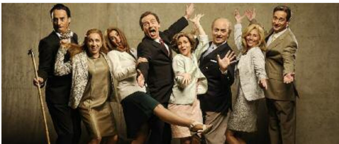
'La família irreal', es preestrena a La Sala

Dansaire de Rubí, Dansa XXI.cat. Rierada 1962 , el 2 de desembre, o El poema de Nadal , representat per Xavier Serrat, el 16 de desembre.