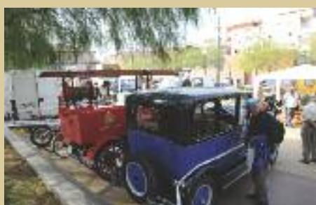
Fira Retro Clàssic, amb l'associació Amics Automòbils Antics