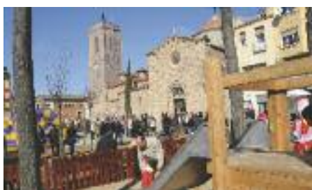
La remodelada pl. del Doctor Guardiet