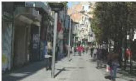
L'illa de vianants