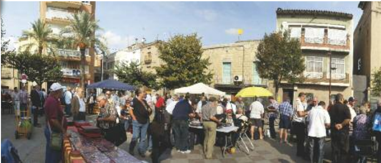
La mostra de col·leccionisme de l'any passat.

La Fira de Sant Galderic arriba enguany a la majoria d'edat i celebra la 18a edició. I en aquesta edició, que se celebra el 20 d'octubre, incorpora més espais i noves activitats. L'aposta per la restauració dels voltants de la Fira amb 'De tapes per la fira' és una de les novetats més destacades: 10 establiments s'han unit per oferir la seva tapa de Sant Galderic. Una altra de les novetats és l'ampliació d'espais, a més de la plaça Doctor Guardiet i el nucli antic, es concentraran activitats a la plaça Montserrat i la plaça Salvador Allende.