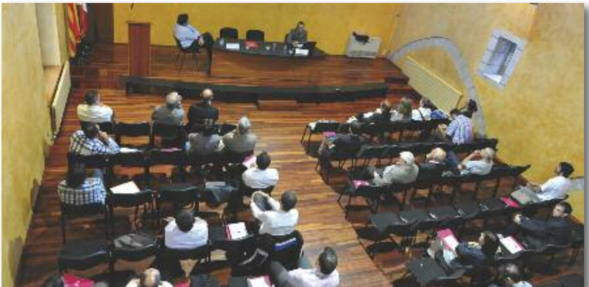
Cerca de treinta empresas participaron de la reunión a finales de septiembre

Desde su puesta en marcha, son ya tres las reuniones realizadas en el marco del proyecto Rubí Brilla con empresas, en materia de eficiencia