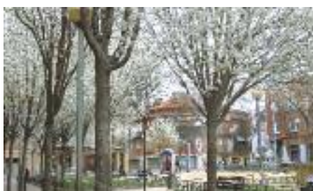
Plaça 11 de setembre en primavera