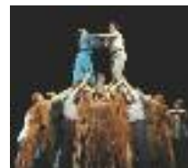
ESBART DANSAIRE L'ESPECTACLE DE L'ESBART ES REPRESENTA AL DESEMBRE

Pel que fa als espectacles familiars, aquests es programen amb la col·laboració de la Xarxa d'Espectacles Infants i Juvenils. Demodés , amb la Cia La Tal & Leandre es representa a l'octubre, Les trifolgues dels germans Garapinyada serà el muntatge de novembre i la tradicional Marató de contes, al desembre.