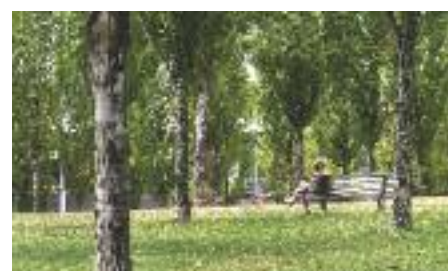
El Parc de la Pau i la Natura