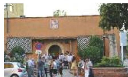
La parròquia de Sant Pau