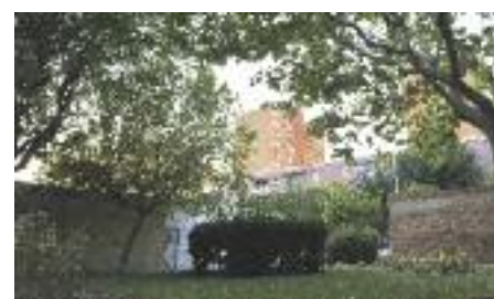
Una de les places del barri

La reconstrucción de la ciudad tras la riada de 1962 y la aceleración industrial, especialmente de los sectores metalúrgicos y químicos, propiciaron la llegada a Rubí de ciudadanos de todo el estado atraídos por la oferta de trabajo. Así nacían nuevas zonas industriales y también nuevos barrios, como el del "Veinte y cinco de septiembre", que acogía sobretodo a las familias damnificadas por la riada del 25 de septiembre de 1962.