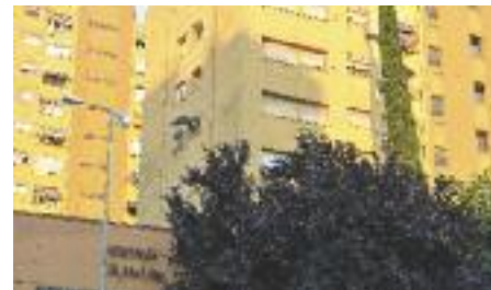
El barri va sorgir arran de la rierada