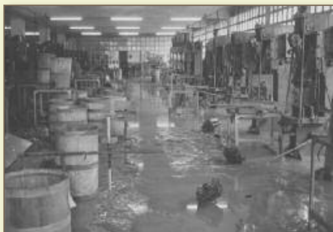
Interior indústria inundada. Autor: Feliubadaló (Arxiu Roset / Arxiu municipal)

Podem concloure, doncs, que els diners de la rierada (crèdits, indemnitzacions, donatius, inversions) i la notorietat adquirida pel nom de Rubí (que es va passejar pels mitjans de comunicació d'arreu) van servir, doncs, per atraure més gent i inversions i per accelerar un procés de canvi econòmic que ja estava en marxa. El creixement urbanístic subsegüent va transformar Rubí molt més que la rierada, nous barris i polígons industrials es van edificar on abans hi havia horts i vinyes. Cal assenyalar, però, que el creixement va ser descontrolat: s'edificava sense urbanitzar, a vegades sense permisos, proliferaven els blocs de gran alçada... mentre els equipaments eren insuficients. La petita estructura municipal (no democràtica) de l'època estava immersa, d'altra banda, en la mentalitat "desarrollista" del moment.