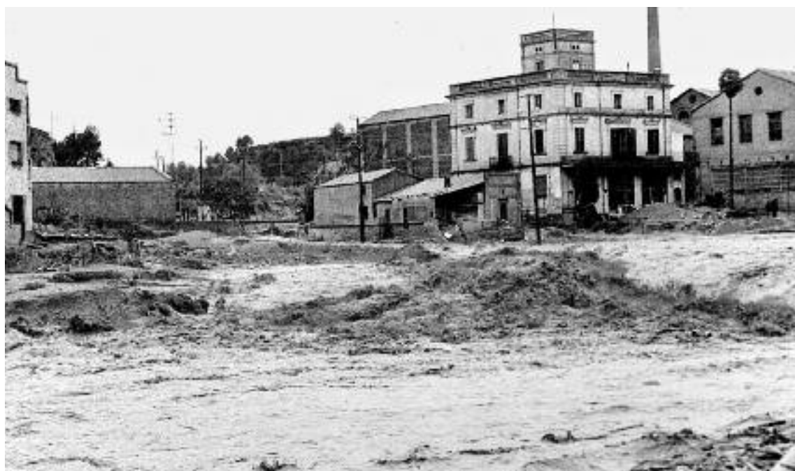
Imatge del segon aiguat (novembre 1962) Autor: Martí Aragonès (L'Abans/Arxiu municipal)

A nit del 25 de setembre de 1962 l'aigua es va endur moltes coses: cases, empreses, etc. Ara bé, el més dolorós és que van morir moltes persones que tenien una vida, un futur. El que no es va poder emportar l'aigua, però, van ser els records de les persones que van quedar i que van perdre familiars i coneguts aquella nit. Aquests testimonis són importants en la commemoració d'aquest 50 aniversari i ens han d'explicar, en primera persona, com van viure aquells fets.