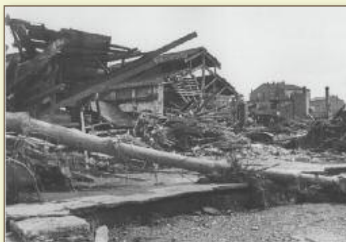
Naus de l'Escardívol destruïdes.