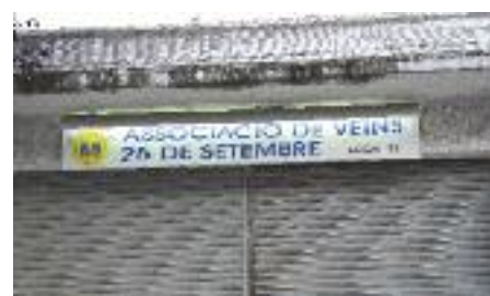
Local de l'Associació de Veïns