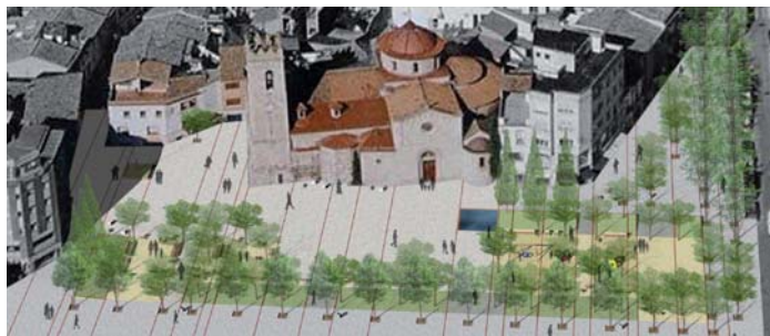
Imatge virtual aèria de com quedarà la plaça, un cop finalitzada la seva remodelació.

L'actual plaça del Doctor Guardiet es feia servir per a espectacles de Festa Major i enguany, amb motiu d'aquestes obres, l'espectacle inaugural amb Antonio Canales i Amador Rojas, el concert de Festa Major o l'actuació de l'Esbart Dansaire, passaran a celebrar-se al Parc del Castell, a l'amfiteatre que s'està construint actualment. El nou disseny de la pl. Dr. Guardiet permetrà que es puguin celebrar activitats culturals com la Fira de Sant Galderic o Sant Jordi, entre altres.