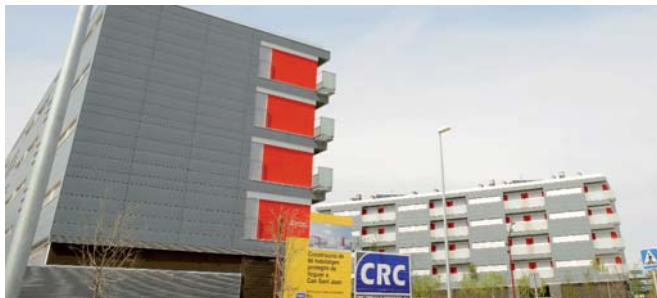
Pisos públics de lloguer a Can Sant Joan. S'obre el termini per sol·licitar 33 habitatges.

per on s'accedeix als habitatges. A la planta baixa s'hi construiran 4 locals comercials i 3 vivendes, una d'elles adaptades. A la planta primera se situen 10 habitatges i l'accés a un local comercial, i a les 3 plantes restants, s'hi construeixen 11 habitatges a cadascuna. En total, aquesta promoció construirà 56 apartaments que cobriran la necessitat de places d'una altra promoció d'habitatges que la societat municipal PROURSA ha previst iniciar a mitjans del mes de juny al carrer Belxite cantonada amb Lepant. Seran 22 pisos de lloguer que completaran l'oferta de venda que ara obre el termini de sol·licituds al carrer Lepant. Una oferta, aquesta darrera, a la que poden optar totes aquelles unitats familiars que disposin d'uns ingressos anuals no inferiors als 6.500 € i no superiors als 53.000 €. Aquesta quantitat varia en funció dels membres de la família.