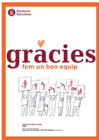
Cartell de la mostra "Gràcies. Fem un bon equip"

A banda de totes aquestes accions més sectorials, l'Ajuntament també mostra a la ciutat diverses exposicions que promouen el civisme i la cohesió social, com ara la mostra "GRÀCIES. Fem un bon equip", que s'ha pogut veure a l'Espai Jove de Torre Bassas.