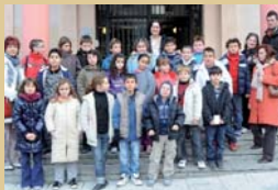
Alumnes del CEIP Ramon Llull van visitar l'Ajuntament