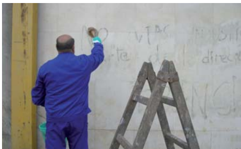
L'Ajuntament ha de reparar els desperfectes que produeixen les conductes incíviques

Aquest pla s'estructura en tres línies estratègiques: fer que els ciutadans coneguin quines actuacions són cíviques i quines no ho són, les normatives i ordenances públiques del municipi i les accions per aconseguir cohesionar socialment els barris.