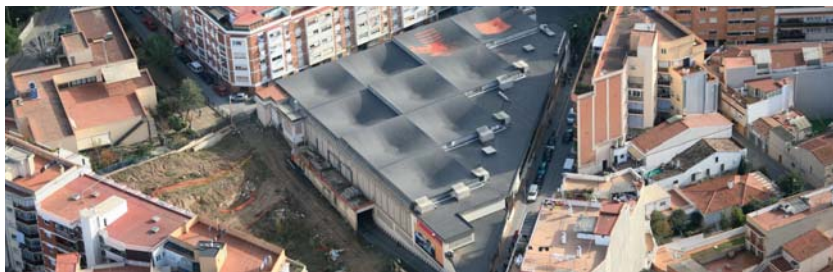
Imagen aérea de la zona del Mercado Municipal

Durante el periodo de 6 meses que dura el contrato, los trabajadores harán acciones de mejora y reparación de 18 calles y avenidas de la ciudad. El Plan de aceras tiene un coste de 1.2 millones de euros y el proyecto ha sido elaborado por un gabinete de arquitectos local. Las obras, que supervisará la sociedad municipal PROURSA, empezarán el 3 de mayo y permitirán la mejora de 5.000 m2 de superficie.