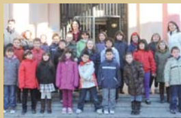
Alumnes del CEIP Schola van visitar l'Ajuntament