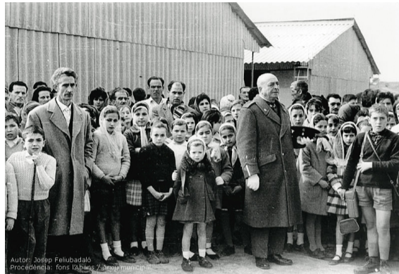
Les víctimes van viure provisionalment en cases de fusta a l'espera de la construcció del nou barri 25 de setembre.