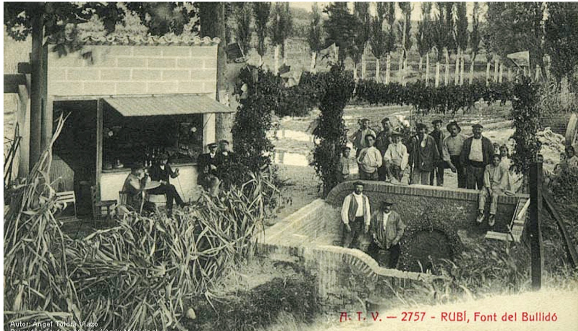
A la Font del Bullidor els joves ballaven a les festes fins a les primeres dècades del segle XX. La rierada la va fer desaparèixer.