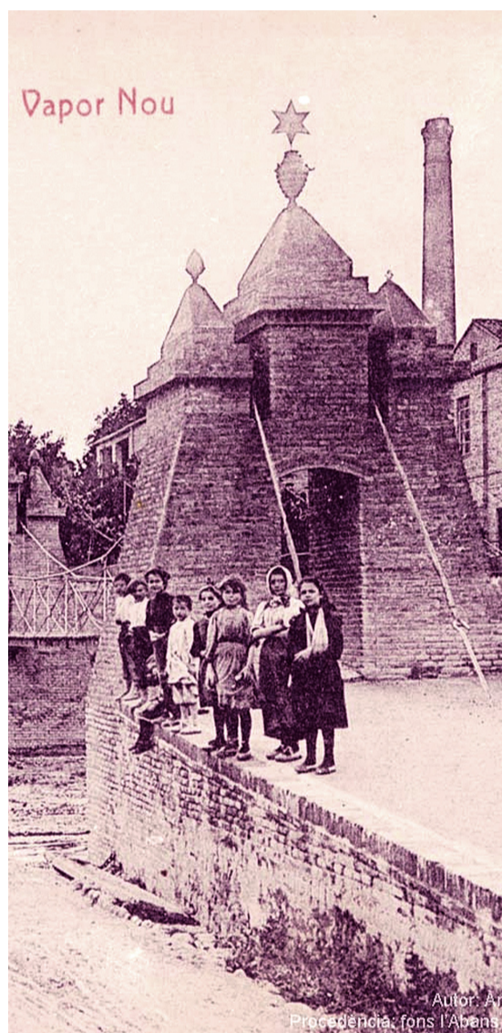
El Pont Penjat situat a prop de la fàbrica del Vapor Nou va desaparèixer arrossegat per la força de l'aigua.

Seguint el mateix model que altres ciutats de la perifèria de Barcelona, Rubí rep durant les dècades dels 50 i 60 una important quantitat de ciutadans procedents del sud del país, atrets per la imatge de benestar i l'oferta de treball. Catalunya va doblar la seva població entre 1940 i 1975 assolint la xifra de 5,7 milions, mentre que Rubí experimentava un creixement del 40% en la dècada dels anys 50. Aquest increment de població va comportar greus dificultats per cobrir totes les necessitats que sorgien en matèria educativa, sanitària i, el que va ser més decisiu en la tragèdia del 25 de setembre de 1962, l'habitatge. En aquest aspecte es va viure un fort moviment especulatiu que va comportar un creixement desordenat. Les noves edificacions van aparèixer de manera incontrolada a la llera de la riera, sobretot a la zona del barri de l'Escardívol, zona on moltes persones novingudes a Rubí van edificar els seus habitatges en terrenys que anteriorment havien estat utilitzats com a horts.