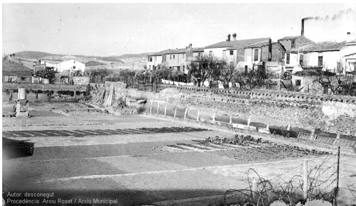
Rubí va ser un poble agrícola fins ben entrada la meitat del segle XX.