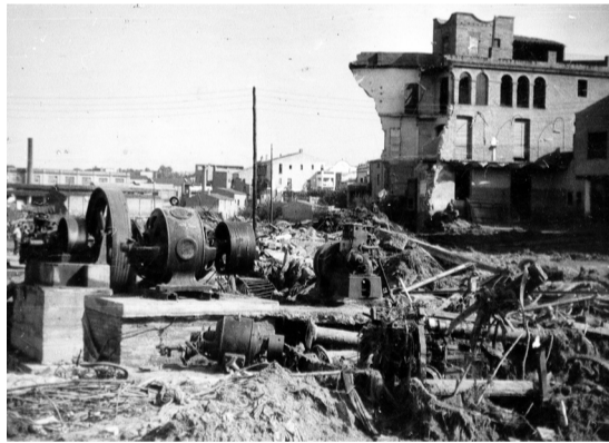
El barri de l'Escardívol al matí següent de la rierada.

Els marges de les rieres no tenien en aquell moment el manteniment adequat i estaven ocupats per canyes, runa i vegetació que van ser arrossegats per la força de l'aigua i dipositats fent de tap al pont situat al carrer Cadmo. La combinació de la gran quantitat d'aigua circulant i l'acumulació de material a la riera en un punt determinat va provocar una tensió màxima que va acabar destrossant el pont i inundant totes les terres adjacents del barri del "Escardívol", que en aquells moments estaven ocupades per habitatges que s'havien anat construint els anys anteriors tant per ciutadans nouvinguts a Rubí, com per ciutadans rubinencs que trobaven habitatges més econòmics que en altres zones de la ciutat. Molta gent, que a aquelles hores estava a casa després de la jornada de treball, no va tenir temps d'abandonar les seves vivendes i va ser arrossegada per l'aigua.