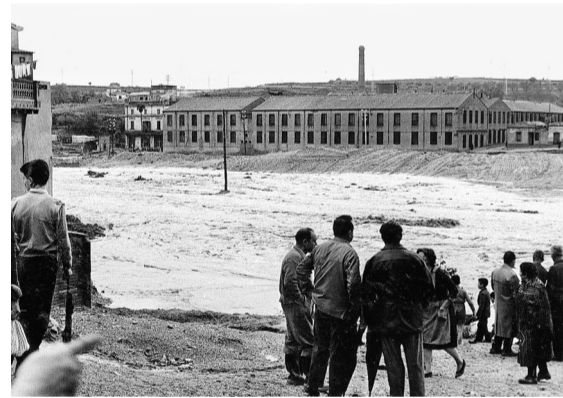
El matí del 26 de setembre encara baixava l'aigua amb força al seu pas per l'Escardívol.