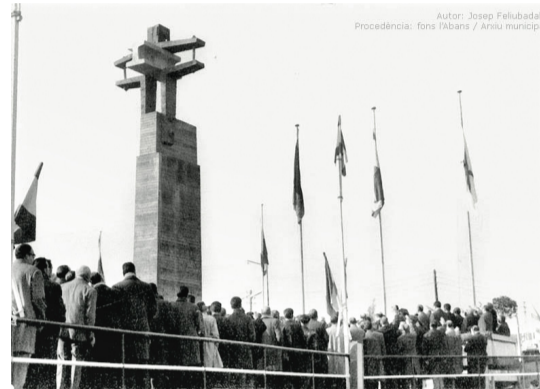
Inauguració del monument en memòria de les víctimes, obra de l'artista català Subirats, al pont reconstruït del carrer Cadmo.